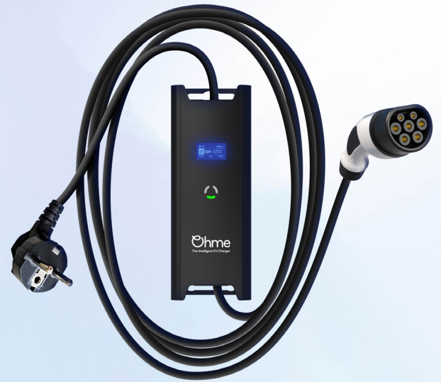
Ohme Go Schuko