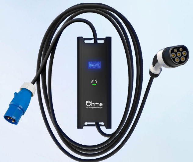
Ohme Go Commando